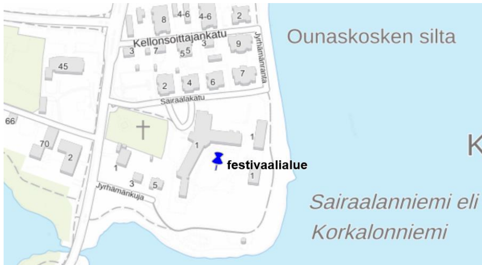
Kuva 1. Tapahtuma järjestetään Rovaniemen Sairaalanniemellä.